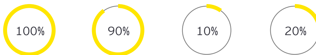
Figur 2 - Iakttagelser rörande fakturornas utformning och innehåll

Saknar hänvisning till det ramavtal som gäller för uppdraget.